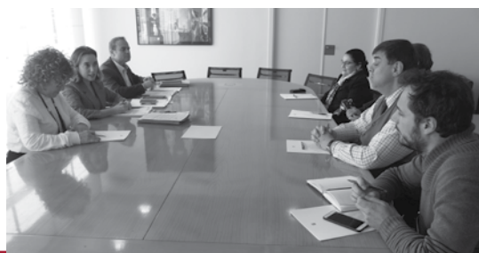
Momento de la reunión de la alcaldesa con el CERMI en La Rioja y el Comité de Representantes de Personas con Discapacidad, para analizar este nuevo Reglamento

Con el tiempo han ido surgiendo nuevas demandas como consecuencia de la evolución de la sociedad: la posibilidad de autorizar el acceso de coches y sillas de niños, o las relacionadas con los problemas de accesibilidad al transporte público de personas con movilidad reducida.