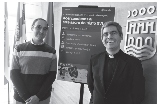
■ El concejal de Patrimonio y el responsable del Archivo Diocesano, en la presentación del ciclo.