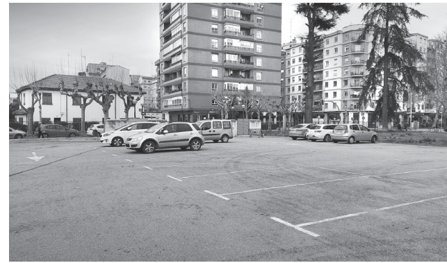
■ Estado actual del aparcamiento gratuito, que cuenta con sesenta plazas y ya está abierto.

Hasta ahora solo se permitía la utilización sanitaria de este solar. Por ello, el espacio requería de un cambio normativo para posibilitar su uso como aparcamiento, que se produjo en enero.