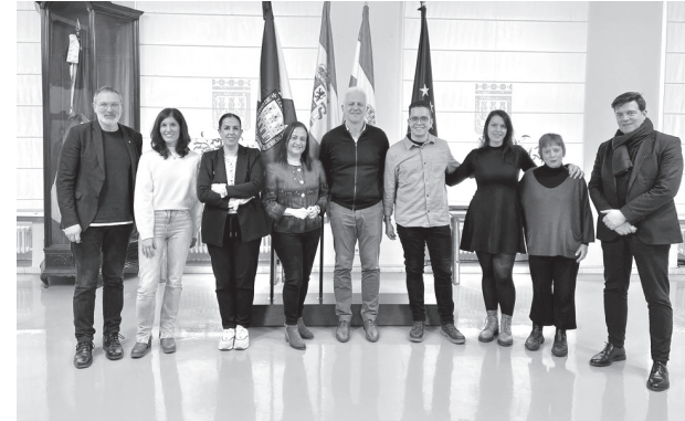
■ Encuentro del alcalde con profesionales de diferentes ámbitos, beneficiarios de las ayudas.

ficados con el objetivo de potenciar el entramado empresarial de la ciudad.