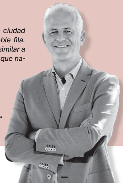
Pablo Hermoso de Mendoza | Alcalde de Logroño

ir en bicicleta y, por tanto, más salud, y una ciudad más amable y sostenible sin la continua doble fila. Logroño camina hacia un modelo de ciudad similar a cualquier ciudad europea. No somos menos que nadie. Logroño avanza.