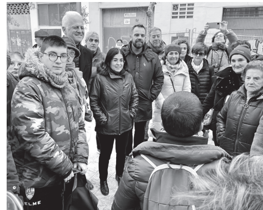
■ La ministra de Sanidad, Carolina Darias, visitó junto al alcalde las obras del entorno del CEIP Madre de Dios y mantuvo un encuentro con miembros de 'Igual a ti' y de 'Logroño comunitario'.

En su visita, la ministra mantuvo una reunión en el Ayuntamiento en la que el alcalde le explicó el modelo de movilidad saludable, sostenible y segura que se ha puesto en marcha durante este mandato. Posteriormente se desplazaron al entorno del CEIP Madre de Dios, donde miembros de la asociación 'Igual a ti' y de la estrategia municipal 'Logroño Comunitario' le explicaron algunas de sus líneas de trabajo, entre ellas, los 'Paseos saludables'.