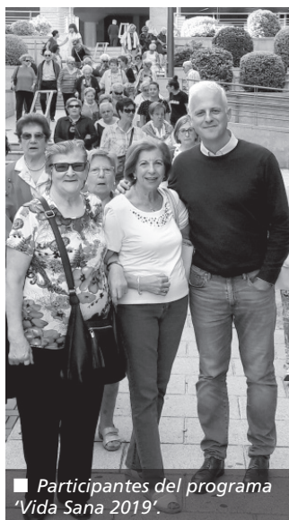
Participantes del programa ‘Vida Sana 2019’.

El teléfono de contacto que tiene dispuesto Fundación La Caixa tanto para participar como para trasladar una posible situación de soledad es el 900 22 30 40, de lunes a viernes, de 9:00 a 17:00 horas. También se puede contactar con el 941 27 70 70, atendido por la Unidad de Servicios Sociales del Ayuntamiento en horario de mañana.