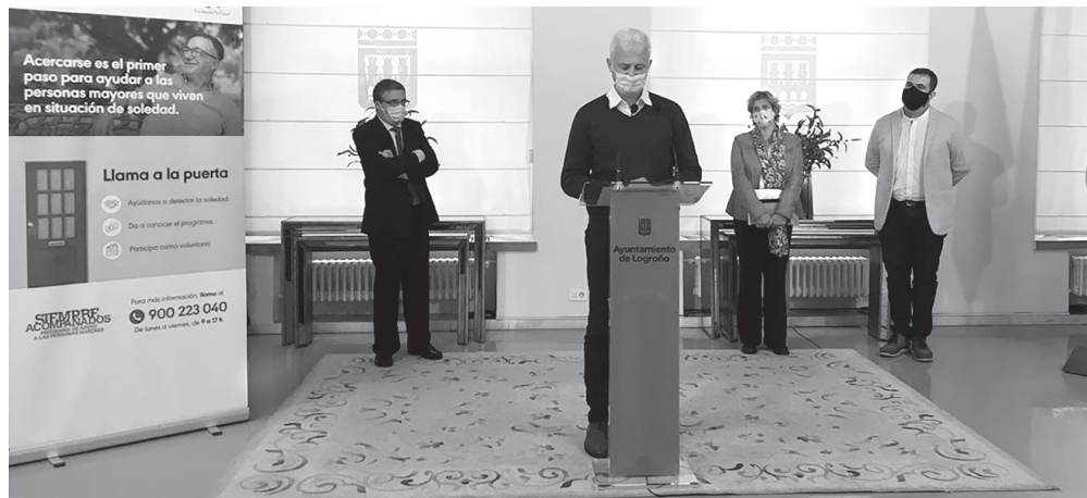
El alcalde de Logroño, el consejero de Servicios Sociales y la directora del programa de mayores de la Fundación La Caixa en la presentación de la campaña.

El objetivo del programa ‘Siempre Acompañados’ es empoderar a las personas en situación de soledad, facilitar la construcción de una comunidad comprometida con ellas y sensibilizar a la ciudadanía para afrontar estas situaciones. En Logroño, se lleva a cabo desde 2018 y, durante este tiempo, ha atendido a 34 personas mayores, ha realizado actividades de sensibilización que han llegado a más de 1.600 personas, y cuenta con la implicación de 17 voluntarios y más de 30 entidades de los barrios San José-Madre de Dios, Centro y La Estrella.