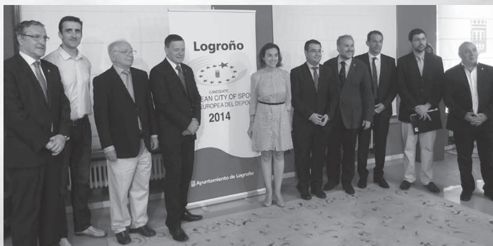
La comisión evaluadora que estuvo en la ciudad quedó muy impresionada con la candidatura de Logroño

El trabajo compartido de todos los logroñeses consigue para la ciudad la distinción que concede la Asociación Ciudades Europeas del Deporte