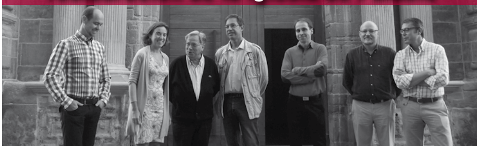
La alcaldesa visitó la iglesia de Palacio acompañada por el párroco y los profesionales que han llevado a cabo la restauración

La alcaldesa de Logroño, Cuca Gamarra, visitó la iglesia de Santa María de Palacio para comprobar el resultado de los trabajos de limpieza y restauración llevados a cabo y las inscripciones que han salido a la luz durante las labores. Los trabajos han consistido en la limpieza de la piedra, la colocación de nuevas cornisas, tapado de grietas y rellenado de algunas piezas de sillería de la parte baja de la fachada, que se encontraban muy erosionadas.