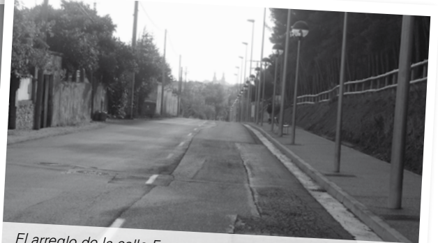
El arreglo de la calle Fuenmayor es una demanda de los vecinos a través de los Presupuestos Participativos