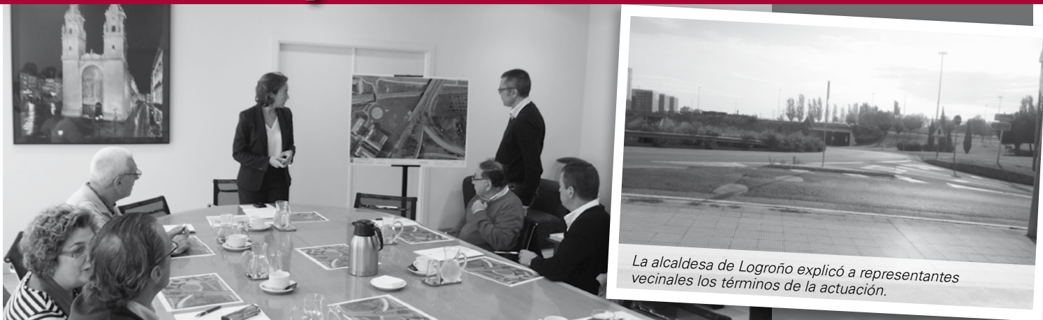
La alcaldesa de Logroño explicó a representantes vecinales los términos de la actuación.