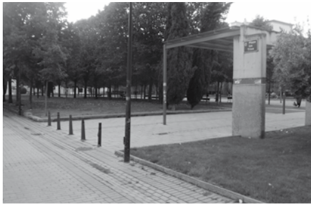
De izquierda a derecha, tres de las obras que se van a acometer con el superávit del ejercicio anterior: la Plaza de los Tilos, la pasarela del Ebro y el entorno del complejo Adarraga

El superávit de 2013 se une al capítulo de inversiones y posibilitará la remodelación del entorno del complejo deportivo Javier Adarraga, la rotonda de Tirso de Molina, la mejora de la Plaza de los Tilos, la reforma de la calle Fuenmayor y la remodelación de la pasarela peatonal sobre el Ebro