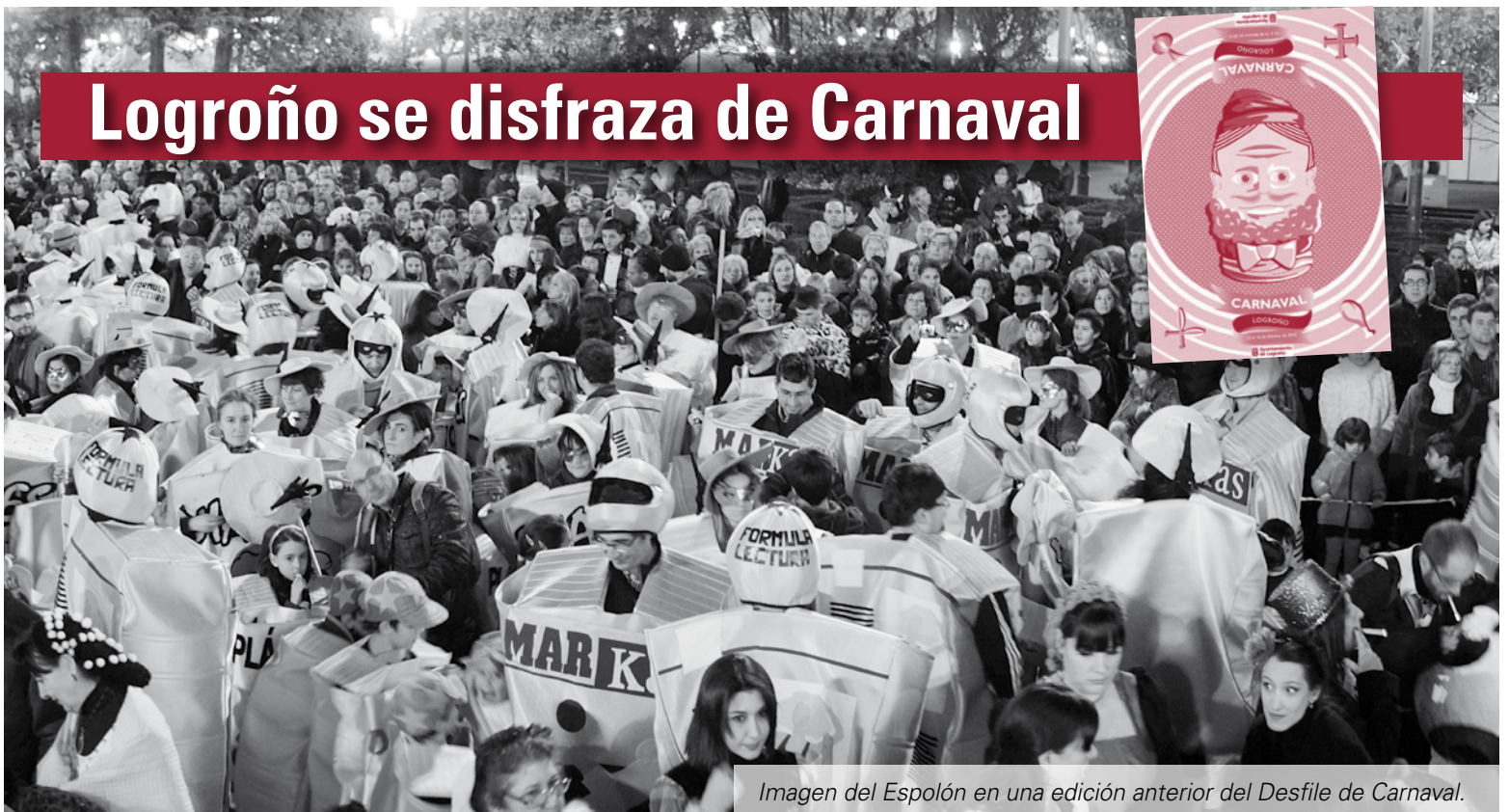
Imagen del Espolón en una edición anterior del Desfile de Carnaval.

El acto central de las fiestas de Carnaval será el desfile, que se celebrará el sábado, 14 de febrero, a partir de las 19 horas. Contará con un total de 1.260 participantes repartidos en 11 comparsas –5 con música en directo y 6 con música grabada-, 1 carroza y 1 grupo.