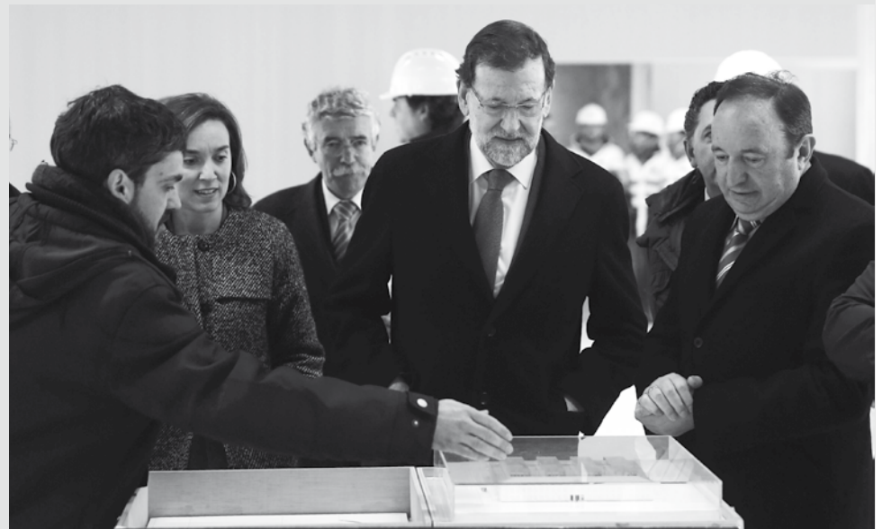
El Palacio de Justicia es un ejemplo de apuesta por la modernidad

En este sentido, el Palacio de Justicia va a beneficiar especialmente “a los vecinos de la zona oeste, que van a contar con un ámbito urbano renovado y mucho más agradable, con más zona verde, aceras más anchas, mayor iluminación y nuevo mobiliario urbano, van a ver revalorizados sus inmuebles y también será importante la repercusión económica para los comercios y los negocios de hostelería.”