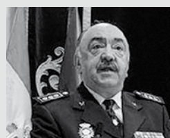
Pedro Mélida Lledó, jefe superior del Cuerpo Nacional de Policía