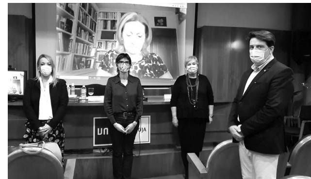
El libro se coeditará con la UNED y se publicará el próximo año.

El libro establece un recorrido por tres líneas de investigación e interpretación que explican los procesos de autoconstrucción femenina que se establecen, fundamentalmente en el siglo XVI, gracias a la conexión entre conocimiento, poder y arte. Los tres ejes sobre los que versa la investigación son: 'Arte, poder y género femenino', 'La creación femenina' y 'Espacios y universos propios'.