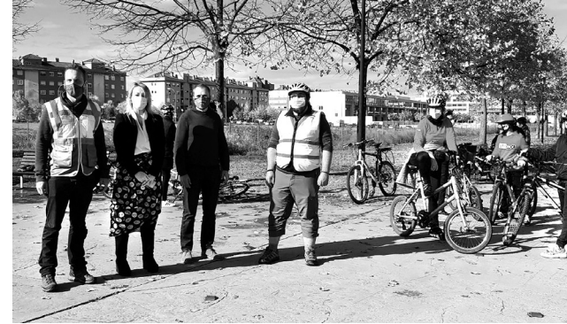
Los talleres formativos se han iniciado en los institutos Cosme García y Sagasta.

Se trata de una iniciativa de la concejalía de Desarrollo Urbano Sostenible que pretende recuperar la cultura ciclista urbana como opción sostenible de transporte. Expertos de La Ciclería llevan a cabo la formación, que utiliza la metodología 'Una bici más', una adaptación española del programa británico 'Bikeability', que es el estándar elegido recientemente por la Dirección General de Tráfico. Logroño se incorpora así a una serie de capitales españolas que