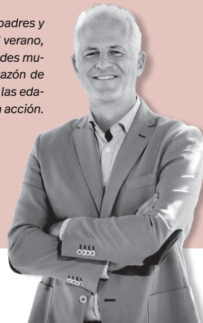
Pablo Hermoso de Mendoza / Alcalde de Logroño

se sientan a charlar en el anfiteatro mientras padres y abuelos les observan a la sombra, y durante el verano, bajo el cielo de Logroño, se organizan actividades musicales, teatrales, culturales que dan vida y razón de ser a un espacio pensado para gente de todas las edades. Ganar espacios, hacer ciudad. Política en acción.