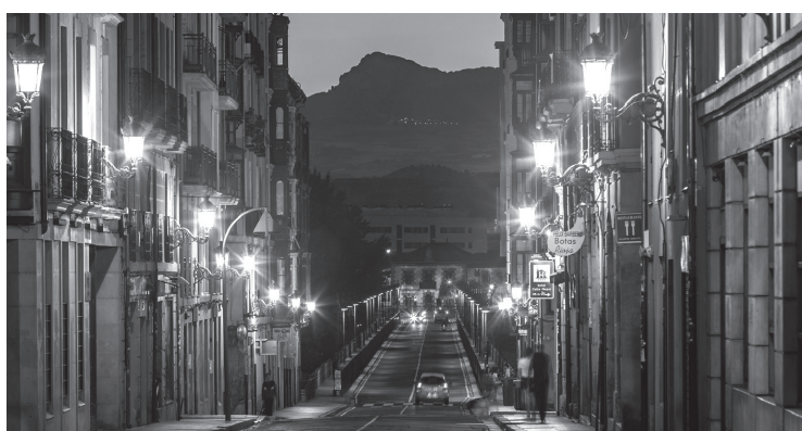
■ La calle Sagasta será de plataforma única, con aceras y calzada al mismo nivel.

E l Ayuntamiento recuperará el carácter urbano de la calle Sagasta con una plataforma única de prioridad peatonal. La actuación se acometerá desde Muro de la Mata hasta el puente de Hierro y tiene un presupuesto total de 1.460.988 euros. El proyecto está financiado por el Plan de Recuperación, Transformación y Resiliencia -financiado por la Unión Europea- NextGenerationEU.