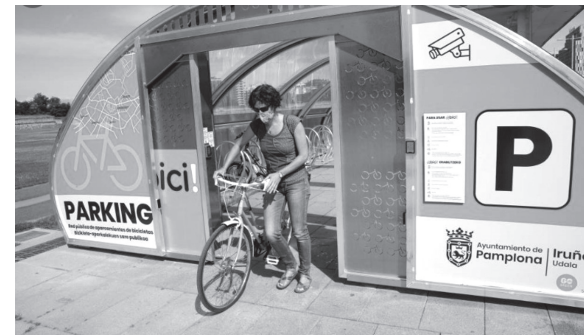
■ Aparcamiento de bicicletas cubierto y videovigilado instalado por el Ayuntamiento de Pamplona.