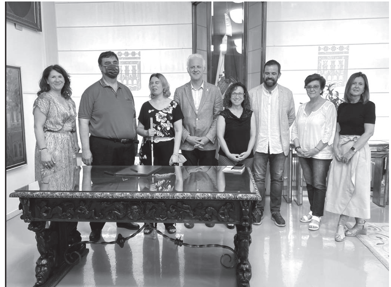
■ El alcalde de Logroño y la directora de Transformación y Excelencia de la ONCE durante la firma del acuerdo.

Es una organización del Gobierno de España que investiga y recoge información sobre discapacidad y la difunde.