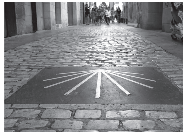
■ El proyecto de cooperación entre Logroño, Burgos, León y Pamplona busca la modernización del Camino de Santiago.