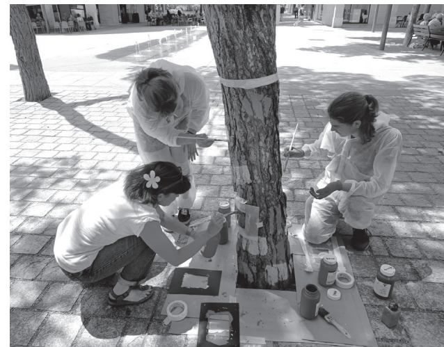
■ Alumnos y profesores del IES Batalla de Clavijo realizan la intervención artística y medioambiental.

Asimismo, Zúñiga ha recordado que para el próximo mes de septiembre se instalará en esta plaza la nueva zona de juegos infantiles, que fue adjudicada en marzo por 328 636 euros y que supondrá la reforma integral del área infantil, en una superficie de unos 500 metros cuadrados, y que incluye novedosos juegos basados en la temática de la naturaleza.