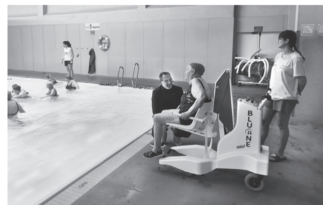
■ Nuevo elevador instalado en la piscina del Centro Deportivo Municipal de La Ribera.

Lograr una mayor accesibilidad en las instalaciones deportivas es uno de los objetivos de esta legislatura. “Que Logroño sea una ciudad inclusiva es una tarea que hay que abordar desde todos los ámbitos de la sociedad, y el deporte se ha demostrado como un instrumento muy útil para lograrlo”, recordó Antoñanzas. Así, en estos años se han realizado actuaciones que han facilitado la accesibilidad a personas con dificultades de movimiento, como la remodelación