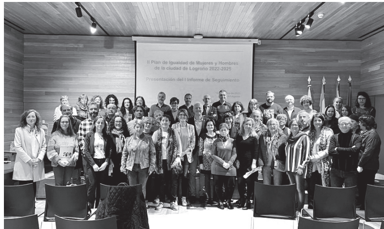
■ El alcalde junto a representantes de entidades adheridas al Protocolo de Duelo, de Igual Participa y de los grupos que han elaborado el II Plan de Igualdad.

E l 25,7 % de las medidas incluidas en el II Plan de Igualdad de Logroño 2022-2025 ya se han cumplido en el primer año de vigencia. Así se desprende del primer informe de seguimiento que se ha presentado en el Espacio Lagares con presencia del alcalde, Pablo Hermoso de Mendoza, junto con representantes de las entidades adheridas al Protocolo de duelo de la ciudad; de los grupos políticos; miembros del proyecto 'Logroño Igual Participa' y de los grupos focales que participaron en la elaboración del Plan.