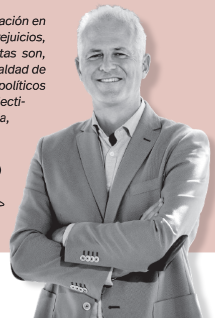
Pablo Hermoso de Mendoza / Alcalde de Logroño

dad a mujeres referentes. Defender una educación en igualdad desde la escuela luchando contra prejuicios, estereotipos, límites mentales y sesgos. Estas son, entre otras, las aspiraciones del II Plan de Igualdad de Logroño, aprobado por todos los partidos políticos presentes en el Consistorio y apoyado por colectivos e instituciones. Un paso adelante, sin duda, un Logroño mejor.