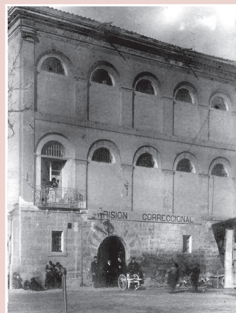
El hospital ya convertido en prisión correccional.

actual Hospital de la Rioja en 1871, el ya vetusto y en desuso edificio se reaprovechó como prisión correccional desde 1888 hasta 1924, aproximadamente.