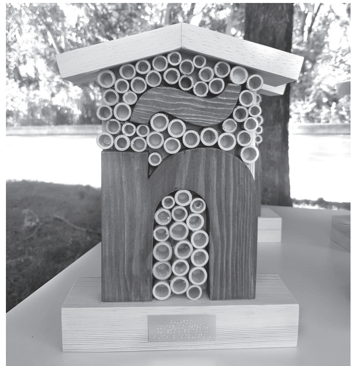
■ Foto de un trofeo de los premios 'Logroño verde'. La forma del trofeo parece un hotel de insectos.

La entrega de premios será el 5 de junio.