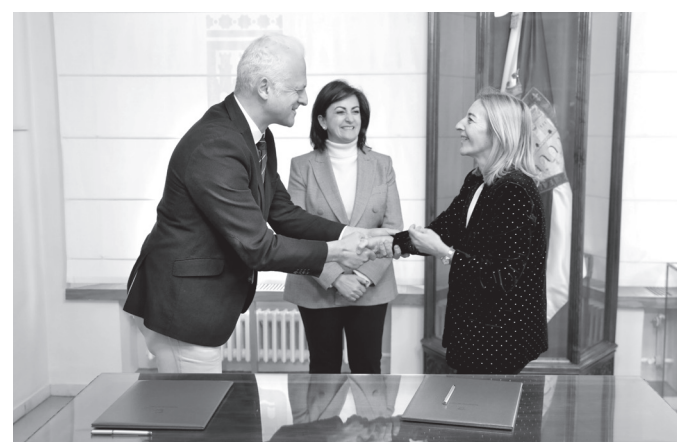
La consejera de Salud, el alcalde y la presidenta del Gobierno de La Rioja, en el acto de la firma del convenio.

El local tiene una superficie construida prevista de 106,98 metros cuadrados, en 98,06 metros cuadrados útiles. Sus instalaciones dispondrán de un área de acceso y sala de espera, área de consultas con dos espacios para Medicina de Familia y Enfermería, aseos, almacén y cuarto de limpieza. El Ayuntamiento de Logroño efectuará la contratación de la ejecución de los trabajos y los suministros al ser los consultorios de atención primaria una competencia municipal.