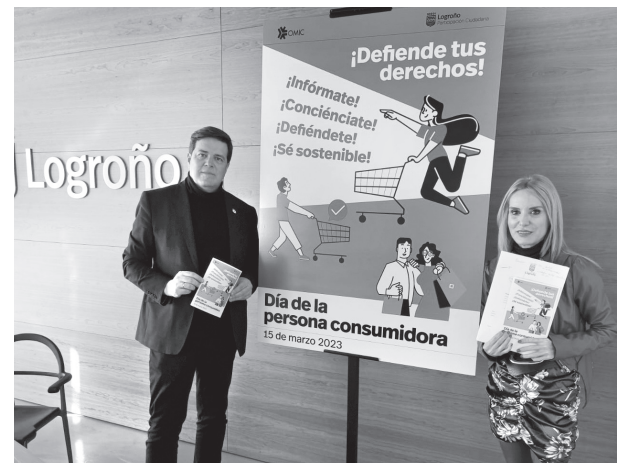
El concejal de Participación Ciudadana y la responsable de la OMIC presentan las actividades.

i Más información: 941 27 70 22 y omic@logrono.es.