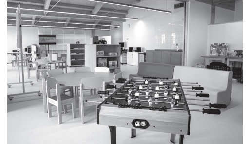
■ El centro, surgido del Presupuesto participativo, ofrece 120 plazas.

E l centro infanto-juvenil 'La Atalaya', ubicado en Valdegastea, ha sido inaugurado, con lo que se amplía a diez la oferta de ludotecas infantiles y juveniles en Logroño. El nuevo centro, que también ofrecerá actividades para adolescentes, oferta 120 plazas, de las que 60 son para niños y niñas y otras 60 para la juventud.