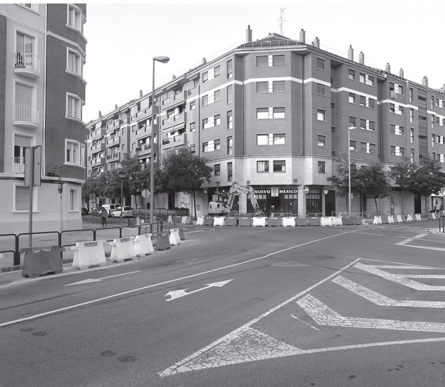
■ Aspecto actual del cruce de las calles Hermanos Hircio y Poeta Prudencio.