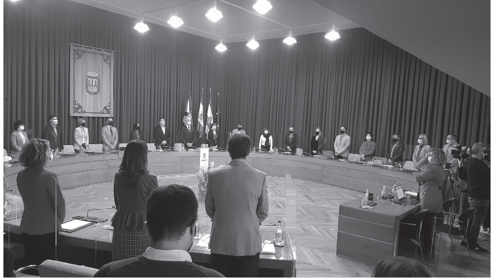
■ Los concejales y concejalas guardan un minuto de silencio en memoria de las víctimas de la COVID-19.

Recordó la puesta en marcha de la primera fase de recogida de materia orgánica, la