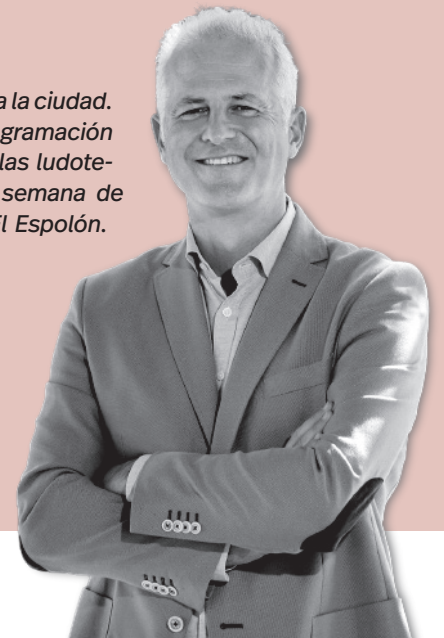
Pablo Hermoso de Mendoza | Alcalde de Logroño

suelto con ello otro de los problemas que tenía la ciudad. Sigamos. Nuestra juventud estrena nueva programación en La Gota de Leche, los Centros Jóvenes y las ludotecas proponen actividades para este fin de semana de Halloween, y la Feria del Libro continúa en El Espolón. Disfrutemos de Logroño.