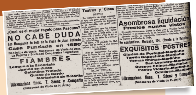
Publicidad navideña, 1921.

repartió un traje completo, una buena bufanda y abundantes turrónes. Aquel año la nación estaba en conflicto bélico, en plena Campaña de Annual contra las tropas de Abd el-Krim, en el Rif. En los cuarteles logroñeses se tenía presente a los soldados destinados en los campamentos africanos. La cena de Nochebuena, en el regimiento de Bailén, consistió en pisto de patatas con huevo y tomate, cordero en salsa, merluza frita, vino, turrón, mazapán y café con coñac. En parecidos términos fue la comida navideña del regimiento de Cantabria: alubias con chorizo y carne de cerdo, merluza con salsa verde, cordero asado, turrón-mazapán, vino y café.