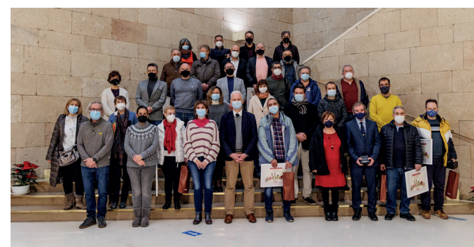
Foto de familia de los miembros de la Corporación con las personas homenajeadas.