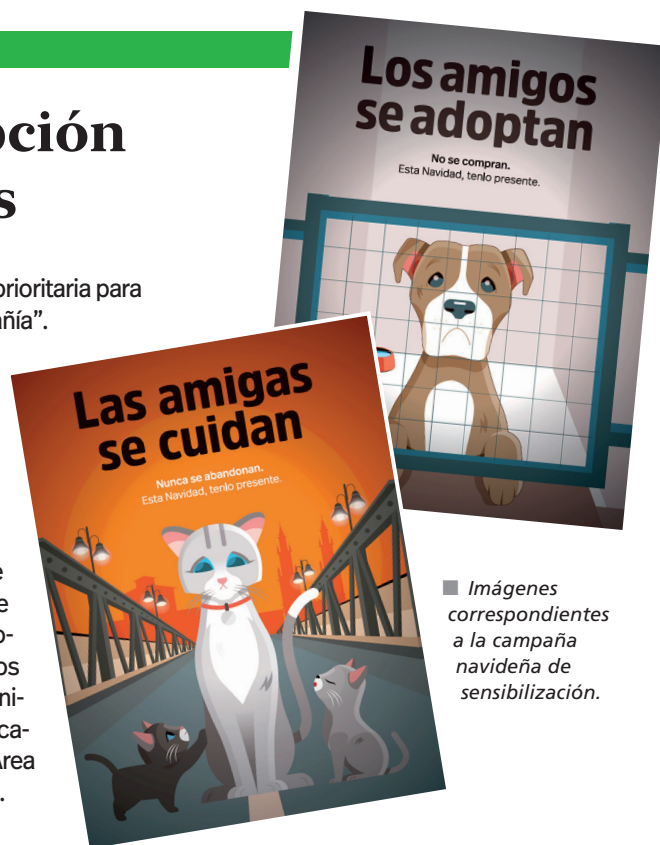
■ Imágenes correspondientes a la campaña navideña de sensibilización.