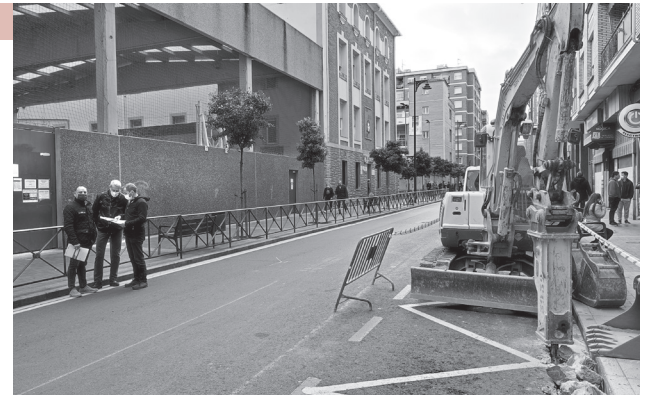
Las obras se han iniciado frente a Los Boscos.

Los contenedores serán reubicados para dedicar todo el ancho de la acera al tránsito peatonal. La banda de aparcamiento, actualmente en un lado de la calle, se dividirá en dos (una parte en los números pares y otra en los impares). Al final de la calle, ya en la intersección con Gran Vía, se hará una segunda modificación del trazado para que