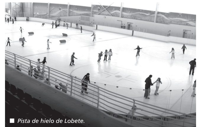
■ Pista de hielo de Lobete.

Ambos proyectos se han contratado con urgencia para poder presentarlos a la convocatoria del Plan de Impulso a la Rehabilitación de Edificios Públicos (PIREP) dentro del marco de los Fondos "Next Generation" promovidos por la Unión Europea. La mejora de estas instalaciones deportivas se tramitará a través de la línea de Eficiencia Energética. "Es llamativo e injusto la inexistencia de ayudas específicas tanto desde Europa como desde el Estado para el deporte municipal. Los Next Genera-