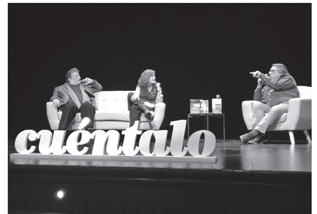
Conversación de la última edición de Cuéntalo.

El Teatro Bretón y el Festival Internacional de Arquitectura y Diseño Concéntrico comparten la cuarta posición, mientras que la Biblioteca Rafael Azcona ocupa la sexta. En este sentido, Concéntrico se presenta como la única representación de La Rioja en el ranking nacional. El Cubo del Revellín, con su nueva exposición permanente sobre el Sitio de Logroño de 1521, aparece por primera vez en el Observatorio de la Cultura junto a instituciones de referencia como el Museo de La Rioja.