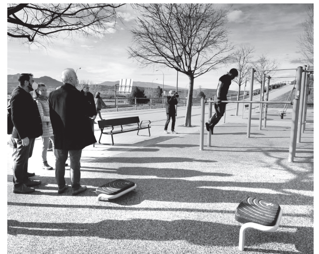
■ Nueva zona de calistenia en El Arco.

Se trata de tres conjuntos de aparatos que están adaptados para personas con discapacidad y que son aptos para la práctica de Cross training , calistenia y Street workout . Todos los equipos están diseñados con resistencia ajustable, permitiendo adecuar el entrenamiento a cada nivel de manera individual. Son equipos altamente funcionales, disponen de grandes letreros de instrucciones y tienen todos los agarres recubiertos por poliurea, un material altamente duradero contra el desgaste. En la actualidad, en Logroño existen áreas de calistenia en la plaza México, el parque de La Ribera ( workout ) y El Arco. En los próximos meses está prevista la licitación de la instalación de otras tres áreas de calistenia en zonas aún por determinar.