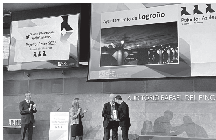
El alcalde recibe las Tres Pajaritas de Papel concedidas al Ayuntamiento.