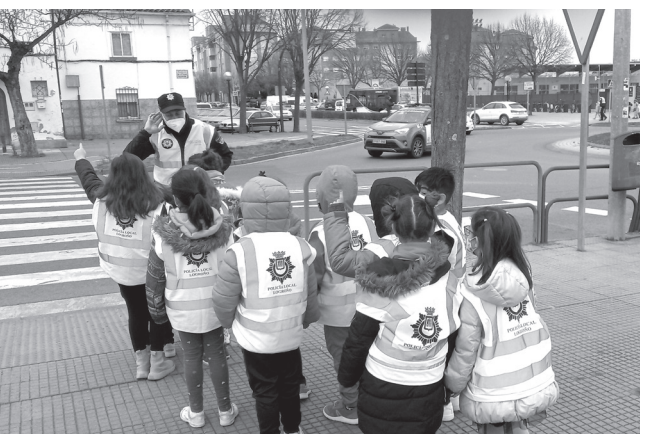
Escolares del CEIP Caballero de La Rosa participan en un curso de educación vial.

En el caso del alumnado de Educación Primaria, se lleva a cabo por grupos un recorrido por las inmediaciones del colegio para conocer su entorno y los riesgos de la circulación asociados a las proximidades de su centro educativo.