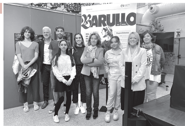
■ El alcalde de Logroño presenta la segunda edición del festival de arte joven 'Barullo Fest 22'.

El alcalde, Pablo Hermoso de Mendoza, asistió a la presentación y recordó que "en las reuniones mantenidas con artistas jóvenes siempre nos han pedido la creación de un festival de verano en la que tuvieran cabida todas las disciplinas y todos los artistas posibles. Les hemos escuchado y desde el año pasado les ofrecemos la posibilidad de que sean protagonistas y creadores de producciones