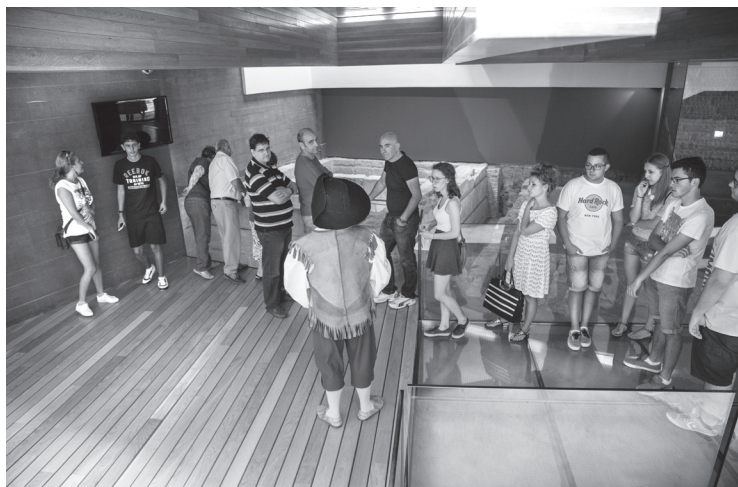
■ Las rutas teatralizadas son uno de los recursos turísticos que ofrece Logroño.