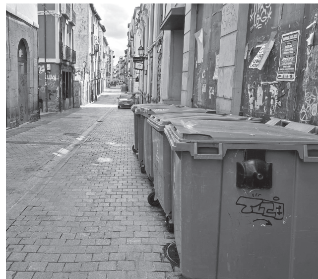
■ Los contenedores estarán la mayor parte del día en un solar municipal en Marqués de San Nicolás 98.

El Ayuntamiento recuerda que el horario de vertido de basura de la fracción resto (contenedores verdes) comprende de 20:00 a 22:00 horas. También incide en la importancia de no depositar los residuos en la calle en los tramos horarios en los que no haya contenedores. De hecho, la Ordenanza de Limpieza recoge multas que pueden alcanzar los 300 euros e incluso superar este importe en caso de reincidencia.