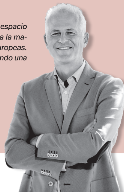
Pablo Hermoso de Mendoza / Alcalde de Logroño

denamos el espacio público y le damos más espacio al peatón, la ciudad se hace más amable para la mayoría. Está pasando en todas las ciudades europeas. Son esas pequeñas cosas que van conformando una ciudad más humana, mejor.