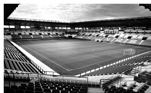
Estadio municipal de Las Gaunas.

El Ayuntamiento traspasará a Logroño Deporte los fondos para cubrir estas ayu-