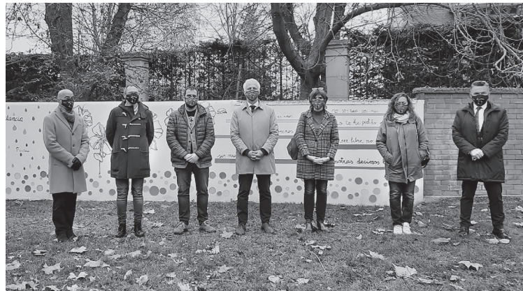
Representantes municipales en el homenaje a las víctimas de violencia machista.

E l Ayuntamiento de Logroño refuerza su compromiso por la igualdad y contra la violencia de género de forma transversal en todas las áreas municipales, sin limitarse a acciones conmemorativas de días especiales. El Consistorio desarrolla acciones de sensibilización y ofrece numerosos recursos en materia de igualdad y para la eliminación de la violencia machista.