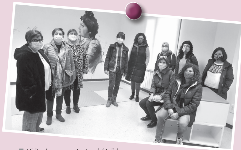
■ Visita de representantes del tejido asociativo al Laboratorio Feminista de Logroño.

Asimismo, el Ayuntamiento, desde su visión transversal de la igualdad y de apoyo a las mujeres que sufren violencia ma-