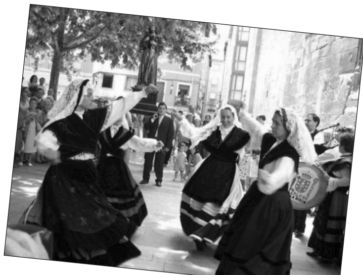
El Centro Gallego tiene su sede en Fundición, 7 bajo. El teléfono de contacto es el 941 228095.