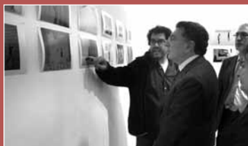
Muestra 'Ábrete libro', en la Biblioteca de La Rioja, con montajes de alumnos del IES Batalla de Clavijo.

Sociedad Micológica Riojana 'Valvanera', el día 25 a las 20.30 h.