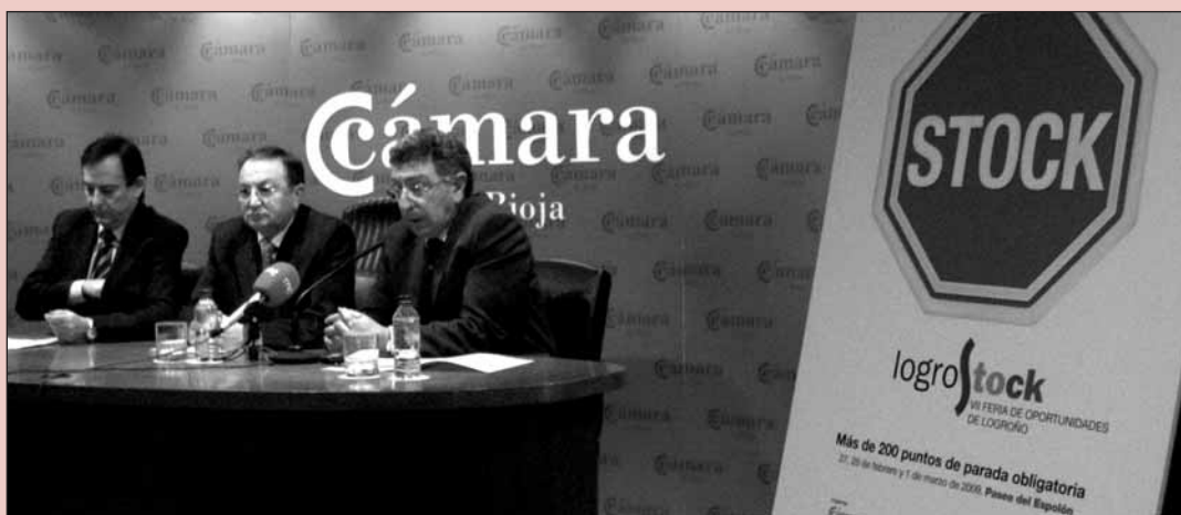
■ La feria Logrostock ha sido presentada esta semana.

El alcalde de Logroño, Tomás Santos, participó el lunes en la presentación de 'Logrostock séptima edición' que se celebrará los días 27 y 28 de febrero y 1 de marzo y en la que el consistorio logroñés aporta 115.000 euros. Santos recordó que por segundo año la feria de oportunidades se celebra en el paseo de El Espolón, lo que confirma el "acierto que supuso el cambio de ubicación, que ha permitido que se instale el número máximo de casetas (240) y que se aumente en 50 el número de comercios que estarán presentes".