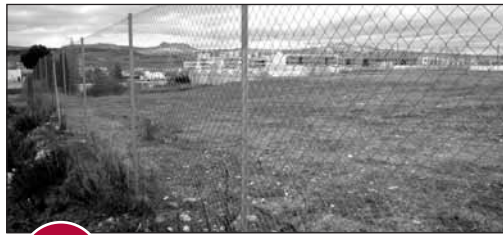
2 PARCELA EN EL ARCO

El 18 de noviembre de 2008 se firmaron las escrituras de cesión de una parcela en El Campillo para dotar a esta nueva zona de un colegio de educación infantil y primaria. La construcción de este centro no figura en los presupuestos del Gobierno Regional para este año.