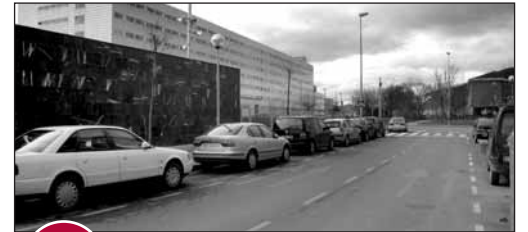
6 SUBSUELO EN LA CALLE RÍO CIDACOS

El 5 de noviembre de 2008, el Ayuntamiento acordó la cesión de una parcela ubicada en la parte trasera del colegio Gonzalo de Berceo, destinada a la ampliación de éste. Aunque la obra está consignada en los presupuestos autonómicos de este año, la aceptación de la cesión por parte del Gobierno de La Rioja aún no ha sido tramitada.