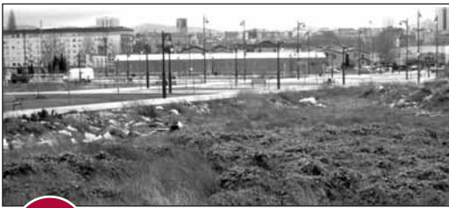
1 PARCELA EN EL CAMPILLO

El 18 de noviembre de 2008 se firmaron las escrituras de cesión de una parcela en El Campillo para dotar a esta nueva zona de un colegio de educación infantil y primaria. La construcción de este centro no figura en los presupuestos del Gobierno Regional para este año.