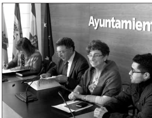
■ Acto de la firma del convenio entre el Ayuntamiento de Logroño y el CERMI.

El Ayuntamiento de Logroño ha firmado un convenio por el que aporta 28.000 euros al CERMI (Comité Autonómico de Entidades de Representantes de Minusválidos) para avanzar en la "integración social de los discapacitados". El CERMI representa a 17.000 personas con minusvalía en La Rioja, de las que 9.500 viven en Logroño. La colaboración entre Ayuntamiento y CERMI ha sido "fundamental" para la redacción del III Plan Municipal de Integración de Personas con Discapacidad que se llevará a cabo entre 2009 y 2012.