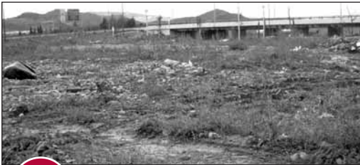
4 PARCELA EN LA GUINDALERA

El 18 de noviembre de 2008 se formalizaron las escrituras de cesión de una parcela ubicada en Las Tejeras que la Comunidad Autónoma había solicitado para construir una residencia de mayores. La obra no cuenta con asignación económica en los presupuestos autonómicos de 2009.