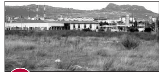
3 PARCELA EN LAS TEJERAS

El pasado 5 de diciembre, el Ayuntamiento acordó la cesión a la Comunidad Autónoma de una parcela dotacional en El Arco para construir un centro escolar. Las escrituras se firmaron ayer, pero el nuevo colegio no ha sido presupuestado por el Gobierno Regional.