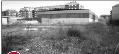
5 PARCELA EN CASCAJOS

El 5 de noviembre de 2008, el Ayuntamiento acordó la cesión a la Comunidad Autónoma de una parcela delimitada por las calles Nestares y Sequoias, destinada a la construcción de un centro de salud que dé servicio a la zona de La Guindalera. Las escrituras se firmaron ayer, pero en el presupuesto para 2009 no hay una consignación específica para su ejecución.