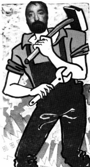
FOTOMATÓN publicado en 1988, en DBF.