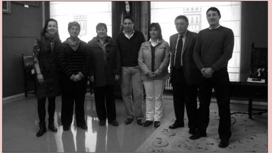
■ Miembros de ARPA y ARSIDO con el alcalde, la concejal de Derechos Sociales y el de Patrimonio.

ARSIDO dispondrá de un local de 149 metros cuadrados, en el que prestará servicios de atención temprana, hidroterapia, logopedia, formación y promoción de empleo, informática y psicomotricidad. ARPA llevará a cabo servicios de atención temprana, informática, orientación, servicio de respiro y actividades de ocio y tiempo libre en los 240 metros cuadrados de que dispondrá.