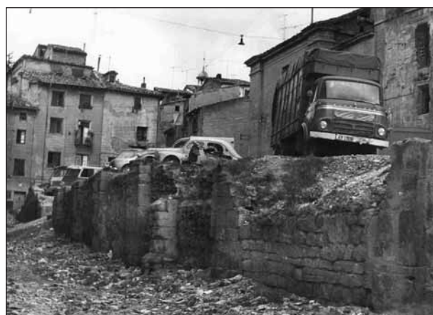
■ Restos del antiguo muro de contención en el entorno de la Iglesia de Santiago.

En el transcurso de los trabajos se hallaron dos elementos: un lienzo más antiguo (el informe apunta al siglo XIV) adosado a la roca natural, que sirvió de arranque al segundo elemento, un bastión de cronología posterior (quizá del XVI) y naturaleza marcadamente defensiva. Era una zona de la muralla seguramente más reforzada que la del resto de la ciudad, por su posición norte mirando al río Ebro y su cercanía al puente fortificado y al castillo-fortaleza. La muralla “de detrás de Santiago” (como es conocida) sirvió de base a casas particulares y a la cárcel pública. A lo largo del siglo XVI