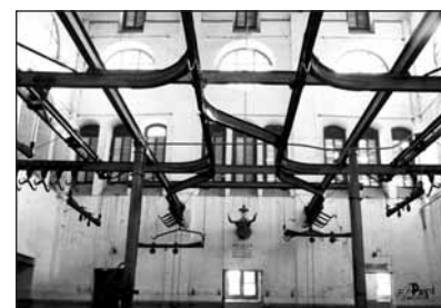
Sala de Oreo del Matadero, 1981.

pal hasta 1981, y en 1999 fue reconvertido en la actual Casa de las Ciencias según el anteproyecto de Bonet, Sierra y Cervantes.