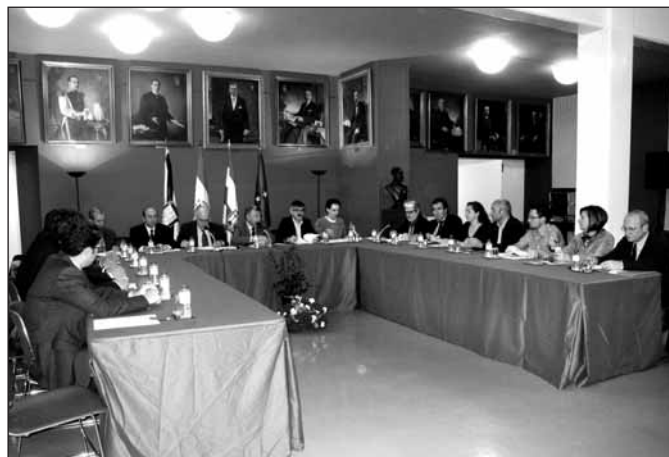
■ El nuevo organismo coordinará el comercio local.