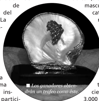
Los ganadores obtendrán un trofeo como éste.

El próximo domingo, 19 de abril, a partir de las 20 horas, los ganadores de este concurso de bel canto recogerán sus premios y a continuación ofrecerán un recital especial para todo el público que acuda a esta cita musical. La entrada es libre.