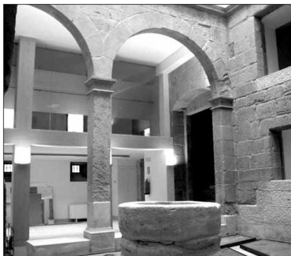
El patio central del Palacio de Monesterio.

En la nueva Oficina Integral de la Seguridad Social se tramitarán afiliaciones y prestaciones, se dará información general a los usuarios y se ofrecerán servicios administrativos de Tesorería. El patio interior del edificio, presidido por un pozo de piedra que ha sido restaurado, cumple la función de vestíbulo. El Palacio de Monesterio cuenta también con sala de espera, sala de usos múltiples y varias estancias que han sido acondicionadas como oficinas.