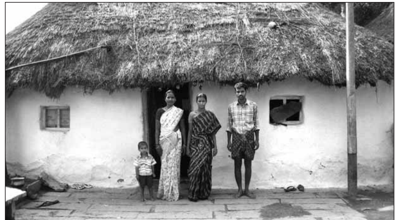
Los fondos servirán, entre otras cosas, para construir viviendas en Anantapur (India).

También estos días se ha aprobado la concesión provisional de subvenciones a entidades sin ánimo de lucro para desarrollar actividades de sensibilización contra la pobreza. A estas iniciativas se dedican 40.200 euros distribuidos en quince proyectos. Programas de integración, publicaciones y charlas son algunas de las actividades que van a ser financiadas con estos fondos.