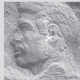
Bajorrelieve esculpido por Rubio Dalmati, a la edad de catorce años, en el muro interior del Cubo del Revellín.