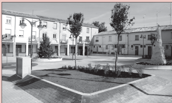
La plaza de la Inmaculada, como nueva.

El Ayuntamiento ha invertido 241.00 euros en la reforma de la plaza de la Inmaculada, que ha renovado su vegetación y cuenta ahora con arbustos y flores de temporada.