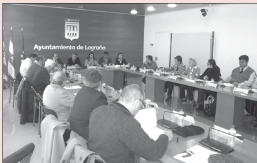
El Consejo Social, en su reunión del pasado martes.

A lo largo de esta semana se han desarrollado en el Ayuntamiento varias sesiones extraordinarias de las Juntas de Distrito para votar las propuestas seleccionadas para el Presupuesto Participativo 2010.