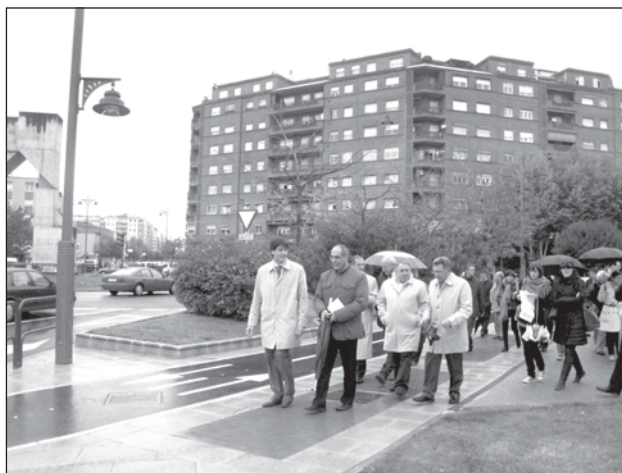
El alcalde y los concejales recorrieron la remodelada Avenida de la Paz.

Las asociaciones de vecinos de San José y de Los Lirios mostraron su satisfacción por la reforma de la calle, financiada con el Fondo Estatal de Inversión Local.