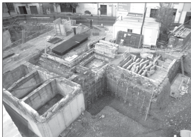
Los lagares formarán parte de un espacio cultural más amplio.

El plazo de ejecución de esta obra es de 16 meses, y tiene un presupuesto de 9,9 millones de euros.