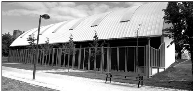
El nuevo frontón, situado a menos de cien metros del anterior, ha quedado perfectamente integrado en el parque del Ebro.

Sobre los restos de la muralla del siglo XIX aparecidos en la calle del Norte -entre el Cubo del Revellín y el Colegio de Arquitectos- se ha construido una nueva sala de exposiciones.