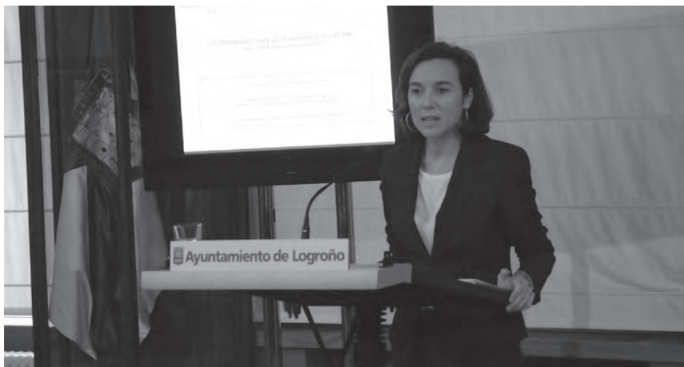
La alcaldesa de Logroño, Cuca Gamarra, desgranó el anteproyecto de presupuestos para 2014