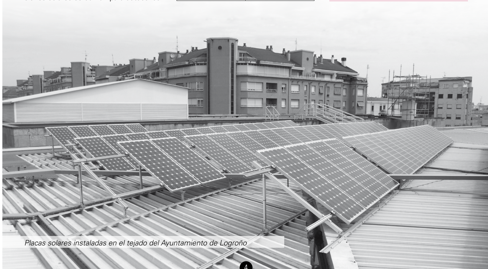
Placas solares instaladas en el tejado del Ayuntamiento de Logroño

La primera instalación fotovoltaica data de 2008 y es la del Centro Deportivo Municipal de Lobete; en 2009 se instaló la del Ayuntamiento de Logroño; en 2010, la del CDM La Ribera; y en 2011 las cinco restantes. En total, suman alrededor de 1.250 paneles solares colocados en los tejados de los edificios municipales, siendo el más extenso el del centro deportivo municipal de La Ribera con 432 paneles solares.