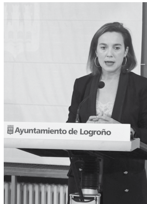
Alcaldesa de Logroño, Cuca Gamarra

de exposición pública, 20 días hábiles contados a partir del primero siguiente al de la última fecha de las publicaciones reglamentarias.