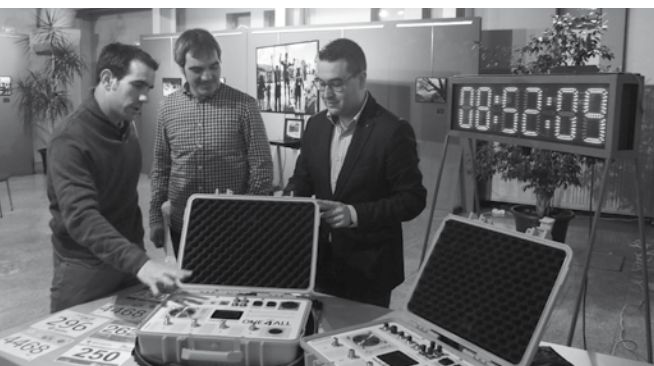
Momento de la presentación de la empresa 'En Movimiento'

Habrà a disposición de los participantes todo aquello que les pueda hacer falta para realizar un evento. Desde medios materiales (equipos de audio, ordenadores o proyectores) hasta canales de difusión.