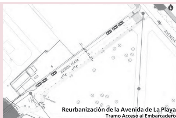
Reurbanización de la Avenida de La Playa Tramo Acceso al Embarcadero

Se renovarán las canalizaciones de servicios y se le dotará de nuevo mobiliario urbano y de señalización horizontal y vertical. En total se actuará sobre 1.100 metros cuadrados.