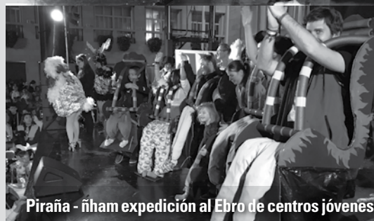
Piraña - ñham expedición al Ebro de centros jóvenes