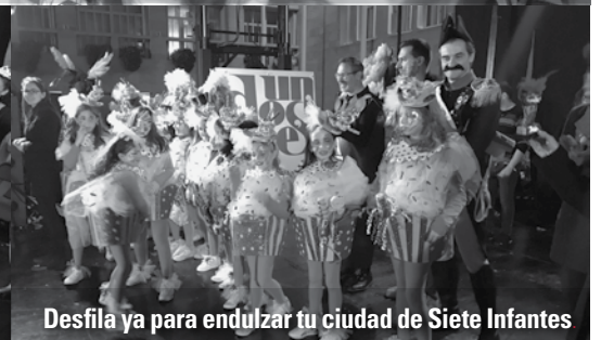
Desfila ya para endulzar tu ciudad de Siete Infantes