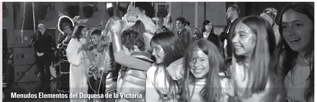
Menudos Elementos del Duquesa de la Victoria

Amigos de Santa Marina, 'Aldeas renovables'