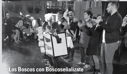
Los Boscos con Boscoseñalízate