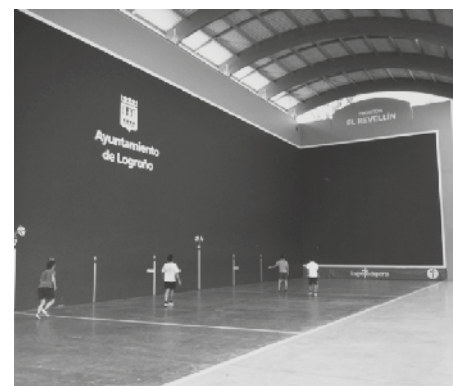
Frontón del Revellín.

terior . El Deporte no solo como elemento de identificación de Logroño entre sus vecinos o entre los que nos visitan sino como elemento de la "Marca ciudad" con la que nos promocionamos en el exterior, buscando hacer también del deporte un motor económico.