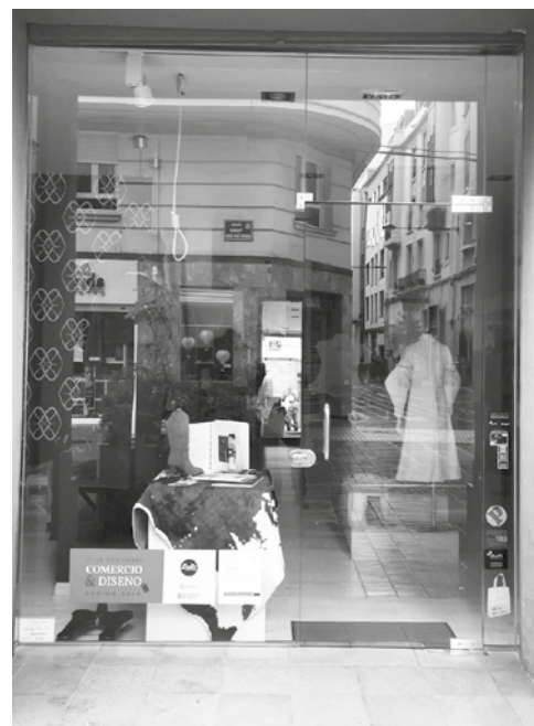
Uno de los escaparates de la iniciativa.