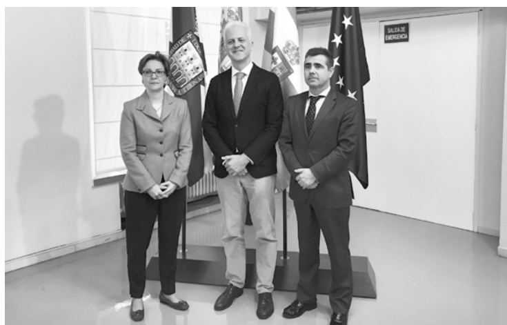
El alcalde, junto con responsables del COIT y AITER.

En el marco de este convenio se desarrollarán acciones como seminarios, cursos y congresos en materia TIC; investigaciones y publicaciones conjuntas; así como la puesta a disposición del Ayuntamiento del conocimiento, el asesoramiento y el apoyo técnico del colectivo de los ingenieros de telecomunicación, entre otras acciones e iniciativas.