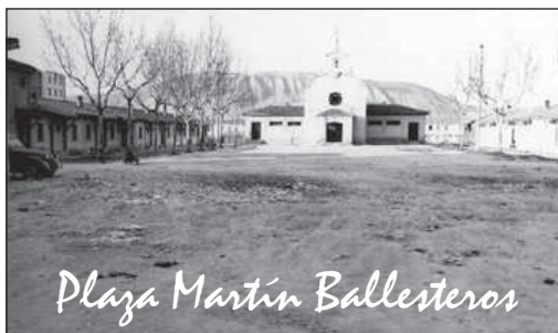
Plaza Martín Ballesteros

En esa plaza quedábamos los amigos: siempre era 'a tal hora abajo', sin tener que decir más. Y después, una vez casado y viviendo en el barrio de San José, mi lugar puede ser perfectamente la Plaza Luis Martín Ballesteros, origen del orgulloso nombre de la gente del barrio, 'soy de Ballesteros', frase que aún dice mi suegro, por cierto. Desde hace dos años, mucho tiempo he pasado allí, esperando a mi