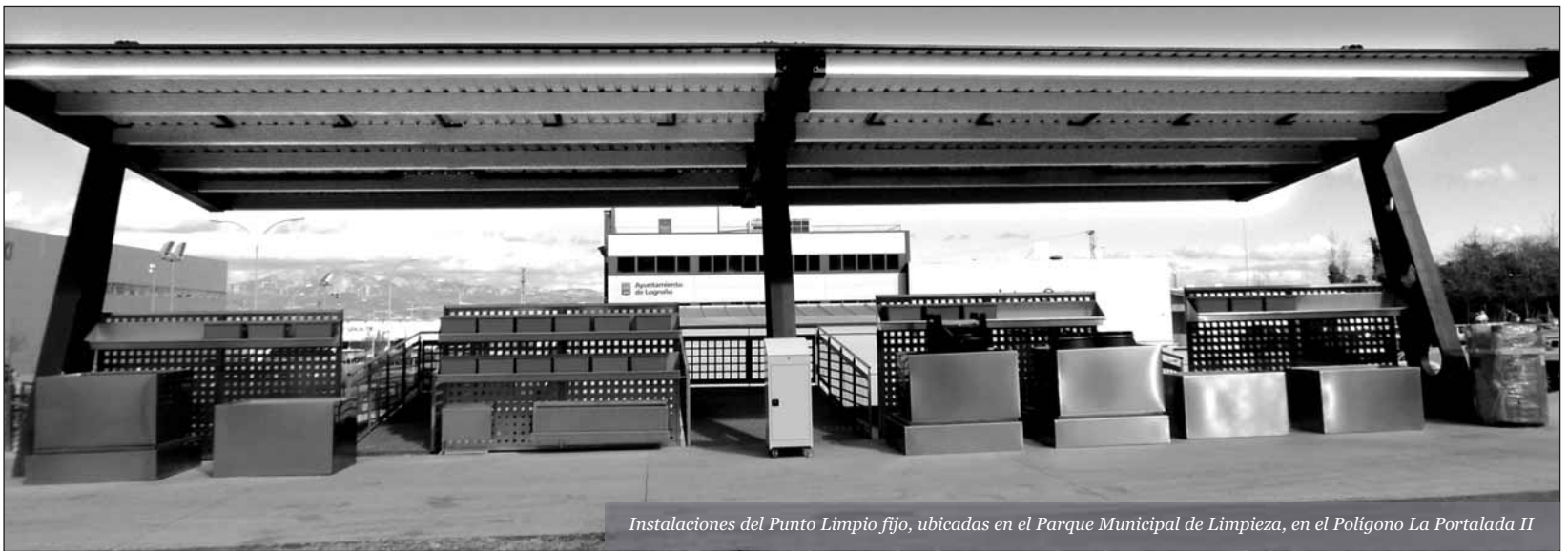
Instalaciones del Punto Limpio fijo, ubicadas en el Parque Municipal de Limpieza, en el Polígono La Portalada II

cada uno de los distritos y barrios de la capital). Su ubicación puede consultarse en la web de Logroño Limpio o en el 010.