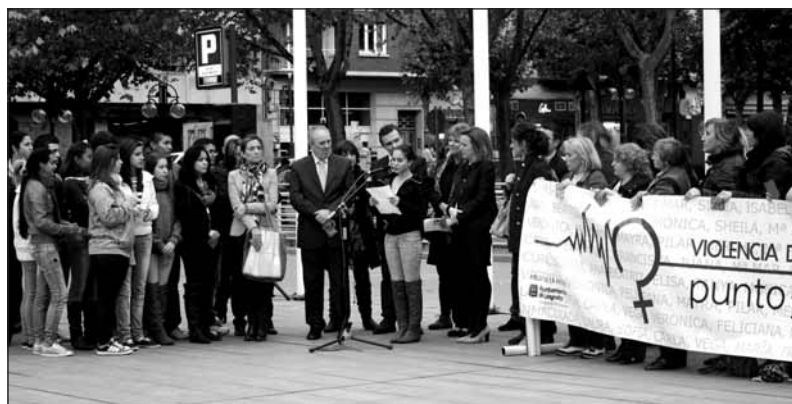
Concentración juvenil. Una joven lee la carta junto a la alcaldesa de Logroño

Pero esta semana es especial por conmemorarse el Día Internacional. Algunas de las actividades organizadas ya se han celebrado, como la 'Rueda de Hombres' , una concentración masculina contra la violencia de género, convocada por Ahige-Rioja; o la exposición del programa 'Quiéreme bien' a estudiantes de Jesuitas; o la concentra-