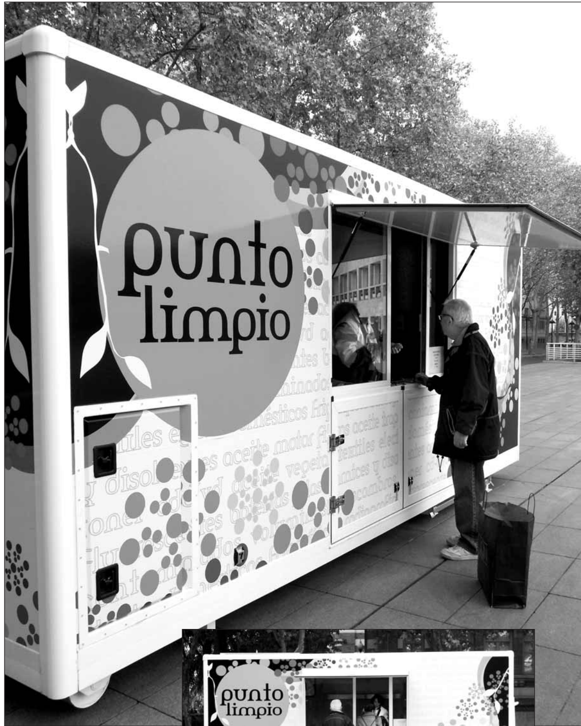
Un continuo peregrinar de ciudadanos se acerca cada día al punto limpio móvil. En la imagen, los viernes se ubica en la plaza del Ayuntamiento

El Punto Limpio, que se encuentra en la calle La Nevera 16, abre de lunes a sábado hasta las 20 horas. Si entre semana abre a las 8, los sábados lo hace a las 9. Domingos y festivos cierra.