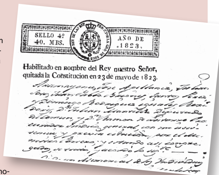
Papel timbrado en las actas municipales 1823.

y casa del mismo, “incluso yo el escribano”, ocupándolos por antigüedad o preferencia de asientos de cada uno.