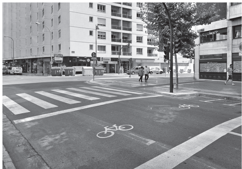
■ Estado actual del eje ciclista a su paso por Avenida de Portugal.