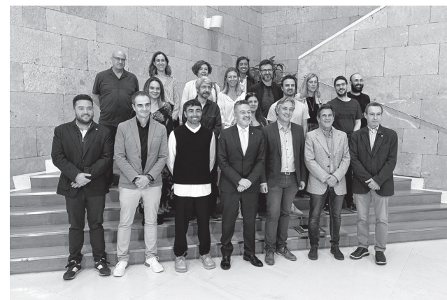
■ Presentación de Concéntrico 10 , el pasado miércoles 18 de octubre en el Ayuntamiento de Logroño

Por otra parte, establece una línea de trabajo continua con los centros educativos de La Rioja, gracias a la colaboración de Planea y Fundación Carasso.