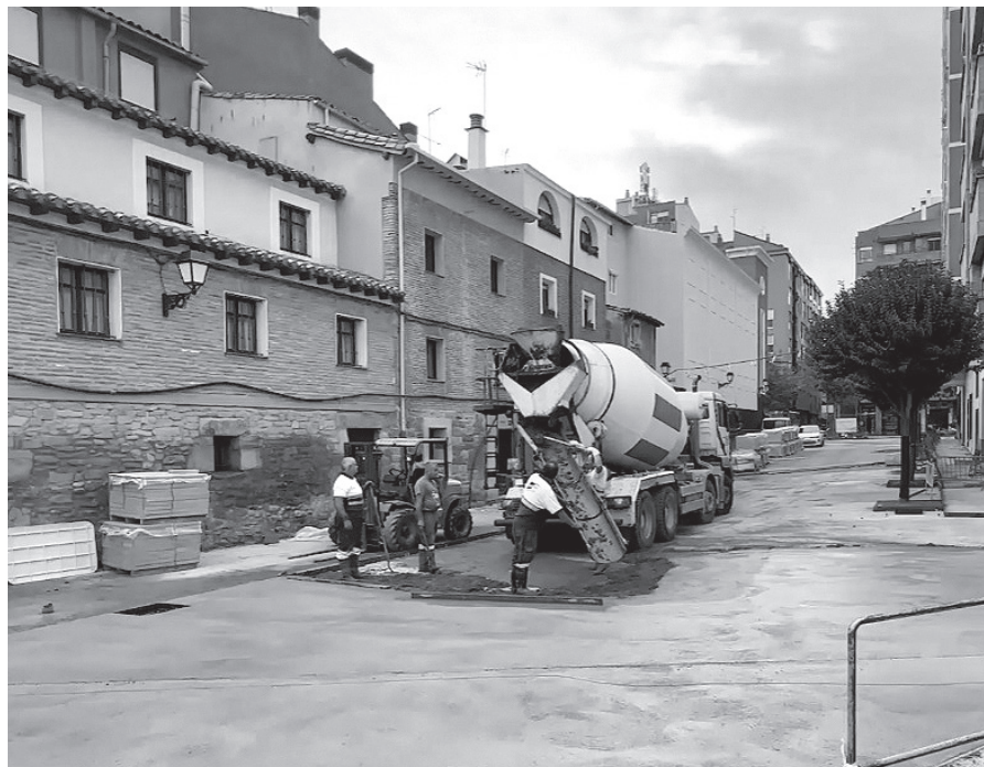
■ Obras en La Villanueva.

En la misma zona está prevista, además, la creación de un espacio destinado a juegos infantiles y otra zona habilitada para la práctica de la calistenia, destinada a las personas mayores. La actuación total tiene un presupuesto de 969.674,91 €.