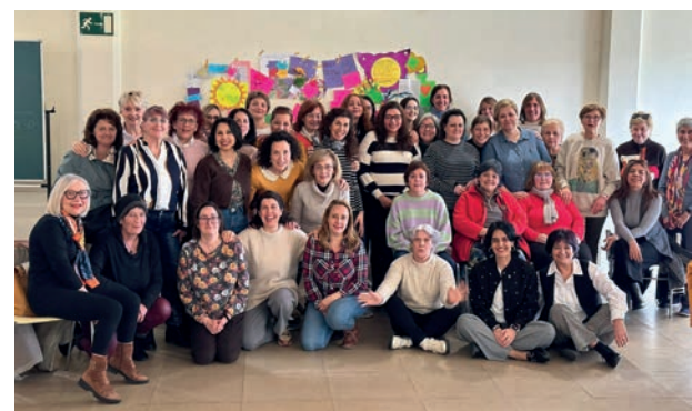
■ Taller celebrado el pasado 6 de marzo en Lobete.

Son actividades en las que se abordan temas como la autoestima y la confianza en una misma, el desarrollo de la capacidad para resolver situaciones difíciles, el conocimiento de las diferentes etapas de la vida de las mujeres y los problemas asociados a las mismas, cuestiones de igualdad y de educación de los hijos, o relaciones de pareja. En las que hay un ambiente excelente, como se puede ver en la última sesión celebrada el 6 de marzo en Lobete, con la asistencia de la concejala