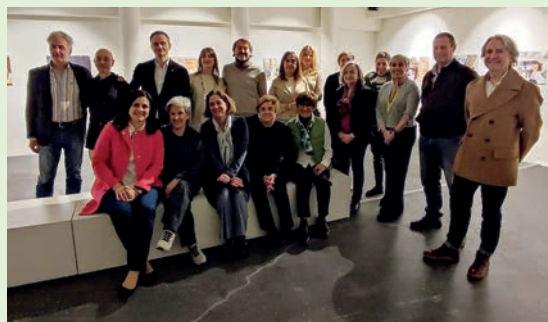
■ Autoridades, protagonistas de la exposición y visitantes participaron en la inauguración.

Con este proyecto, el Ayuntamiento pretende destacar la visión de lo femenino