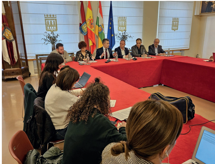
El alcalde y varios miembros de la Corporación presentaron las medidas.

El alcalde destacó de las mismas que “culminan el proceso de diálogo al que toda la