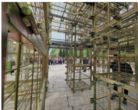
■ Las intervenciones de Concéntrico invitaron a una visita diferente de la ciudad.

A falta de valoración definitiva de los datos, Concéntrico se confirma como un eficaz foco de atracción de visitantes. Si en 2023 se contabilizaron más de 40.000 visitas a sus instalaciones, las sensaciones y los datos registrados en los últimos días apuntan a una afluencia que superará esas cifras.