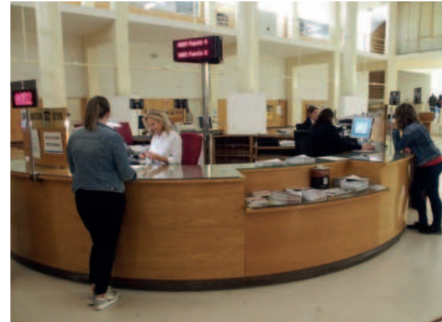
■ Servicio de atención al ciudadano en la planta baja de Ayuntamiento.

El cuestionario dirigido a ciudadanos constará de tres partes (Policía Local, Bomberos, y Emergencias y Comunicaciones). En cada sección encontrará una serie de pre-