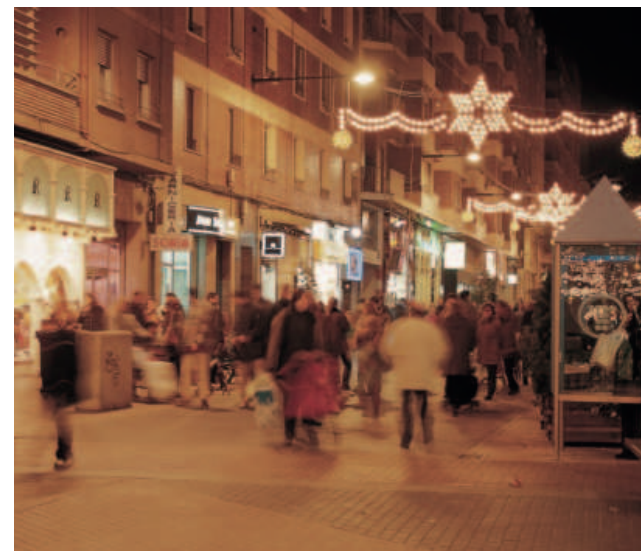
■ El comercio logroñés contará con nuevas ayudas.

Por su parte, la otra línea de ayudas, la de 'Nuevas iniciativas' consta de 2 modalidades. Por un lado, la de 'Nueva iniciativa comercial', para financiar parcialmente la creación de microempresas que inicien una actividad comercial, con cuantías que podrán llegar hasta a 5.000 euros. Por último, la modalidad 'Nueva iniciativa', para