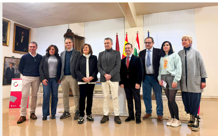
Los premios suponen un homenaje al comercio logroñés.

En esta octava edición, se recibieron 37 candidaturas a las cinco modalidades, de las que 18 fueron para los premios honoríficos, de reconocimiento a la labor de los comerciantes y que se representa mediante un diploma y una placa conmemorativa; y 19 candidaturas para los premios de mérito, que acreditan una acción o labor concreta y