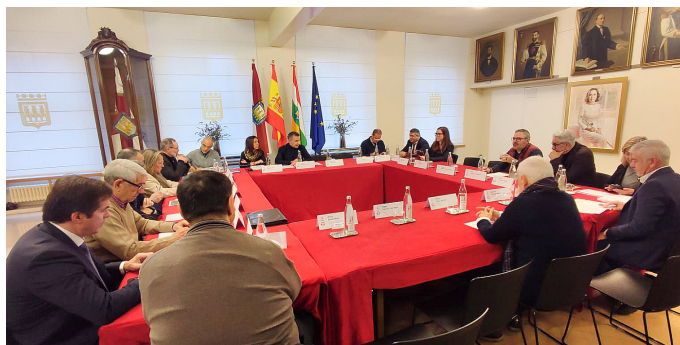
■ El proyecto de Presupuesto recibió el respaldo mayoritario del Consejo Social.

dustrial, impulso del Plan Municipal de Vivienda y del modelo de ciudad circular, mejora de servicios y dotaciones en los barrios.