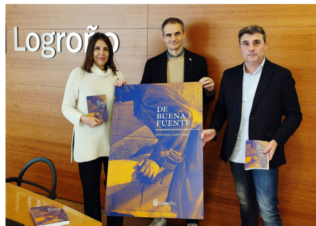
Presentación del certamen en la sala de prensa del Ayuntamiento de Logroño.

El jurado de este premio de narración breve estará integrado por distintos representantes del Ayuntamiento de Logroño y de Fundación Caja Rioja, así como un experto en la materia.