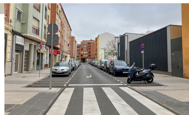
■ Imagen de una de las calles incluidas en la ZBE.

En la primera fase, tendrán acceso a la zona delimitada los coches con distintivo ambiental: categorías 0 emisiones, ECO, C y B. Quedarían exentos de la restricción de acceso vecinos, comerciantes y todas aquellas per-