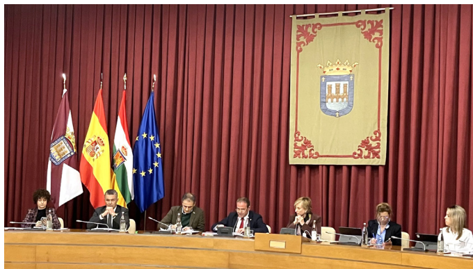
■ Imagen del Pleno en el que se aprobó el Presupuesto para 2025.

Con 20,2 millones de inversiones previstos en el próximo ejercicio, el Presupuesto contempla partidas importantes en promoción in-