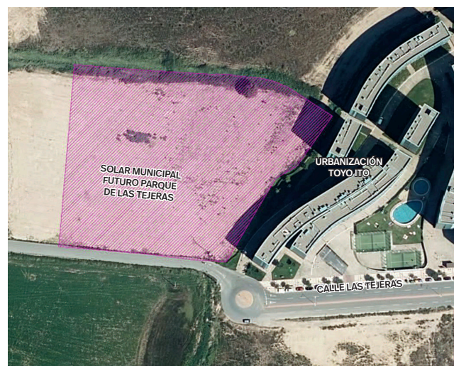
■ Zona de actuación para el futuro parque de Las Tejas.

Finalmente, la Junta de Gobierno Local dio luz verde a los proyectos y licitación de obras de renovación de la red de agua potable en varios puntos de la ciudad. El importe total asciende a 280.605,66 euros y se incluyen actuaciones en cuatro calles de la ciudad: Beatos Mena y Navarrete (entre Cigüeña y San José de Calasanz), Beratúa (entre Murrieta y Conde Superunda y calle Gonzalo de Berceo/Valcuerna), Ciudad de Vitoria (tramo calles Fundación/Lardero) y San Millán (tramo Cigüeña/avenida de la Paz margen números pares).