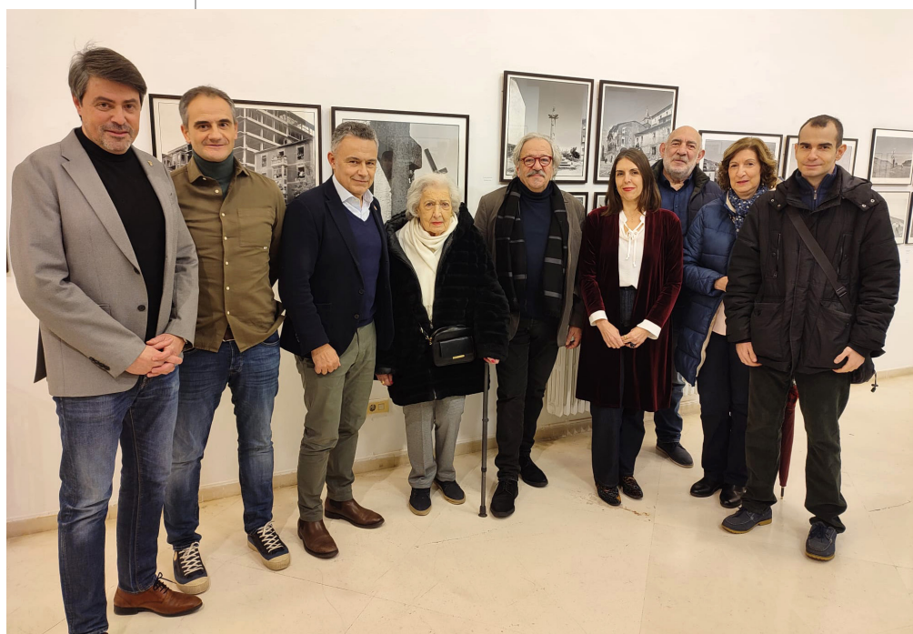
■ Inauguración de la exposición 'El tiempo de Teo'.