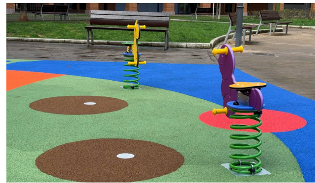
■ Además de los juegos, se instalará una cubierta textil.

En el 2024, el Ayuntamiento de Logroño invirtió cerca de 300.000 euros en la sustitución de suelos y juegos de áreas infantiles distribuidas tanto en parques como en centros educativos de la ciudad. Este tipo de actuaciones en los parques de varias zonas de la ciudad permiten potenciar el carácter lúdico, de punto de encuentro e integrador de estas áreas.