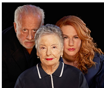
'La reina de la belleza de Leenane'