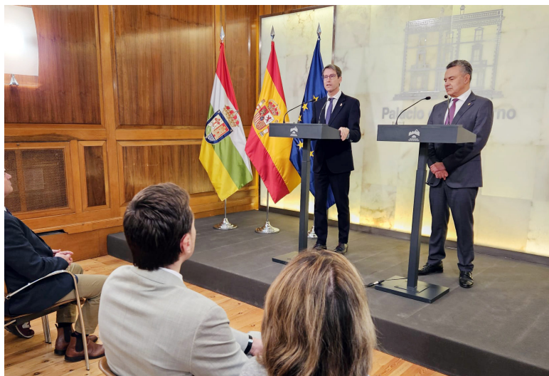
■ El alcalde y el presidente de La Rioja informaron de la cesión.

A partir de ahora, el Ayuntamiento será el encargado de la gestión, explotación y conservación de la vía. Para financiar dichos trabajos, el Consistorio logroñés recibirá