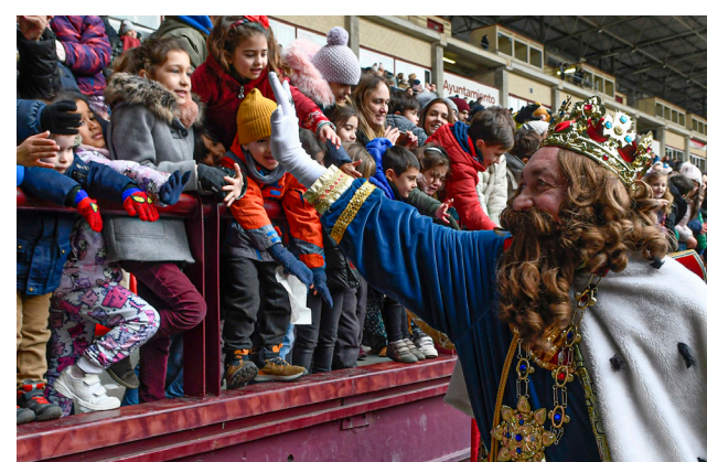
■ Logroño se ha volcado con la programación navideña.