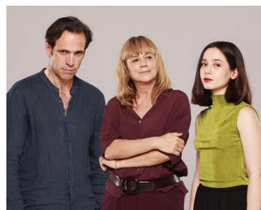
'El cuarto de atrás'