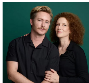
'Cortázar en juego'