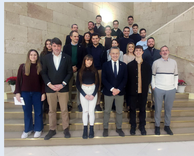
■ Integrantes de la red de talento joven de Logroño, junto al alcalde y otros miembros de la Corporación.

La mejora de las comunicaciones con las ciudades del entorno y el trabajo en aceleradores de empresas destacaron entre los temas de mayor interés en esta reunión, en la que también se planteó el incremento de la presencia de artistas locales en la programación cultural. La propia consolidación y ampliación de la red de talento joven fue otra de las cuestiones abordadas.