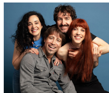
'La piel fina'