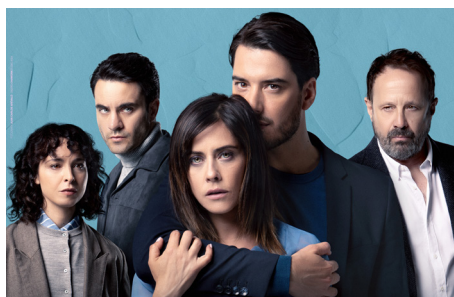
'Casa de muñecas'