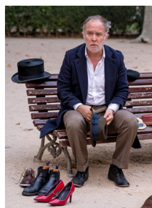
'Hoy tengo algo que hacer'