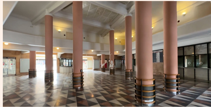
■ Fachada y hall de la antigua estación de autobuses de Logroño.