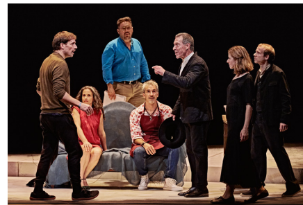
'Seis personajes en busca de autor'