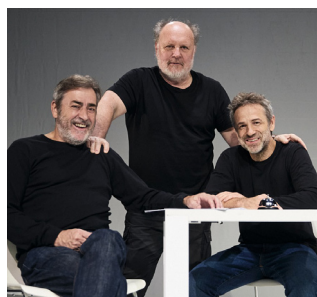
'Encuentros breves con hombres repulsivos'