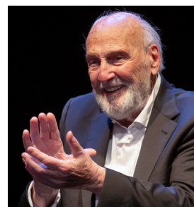
'Una pequeña historia'