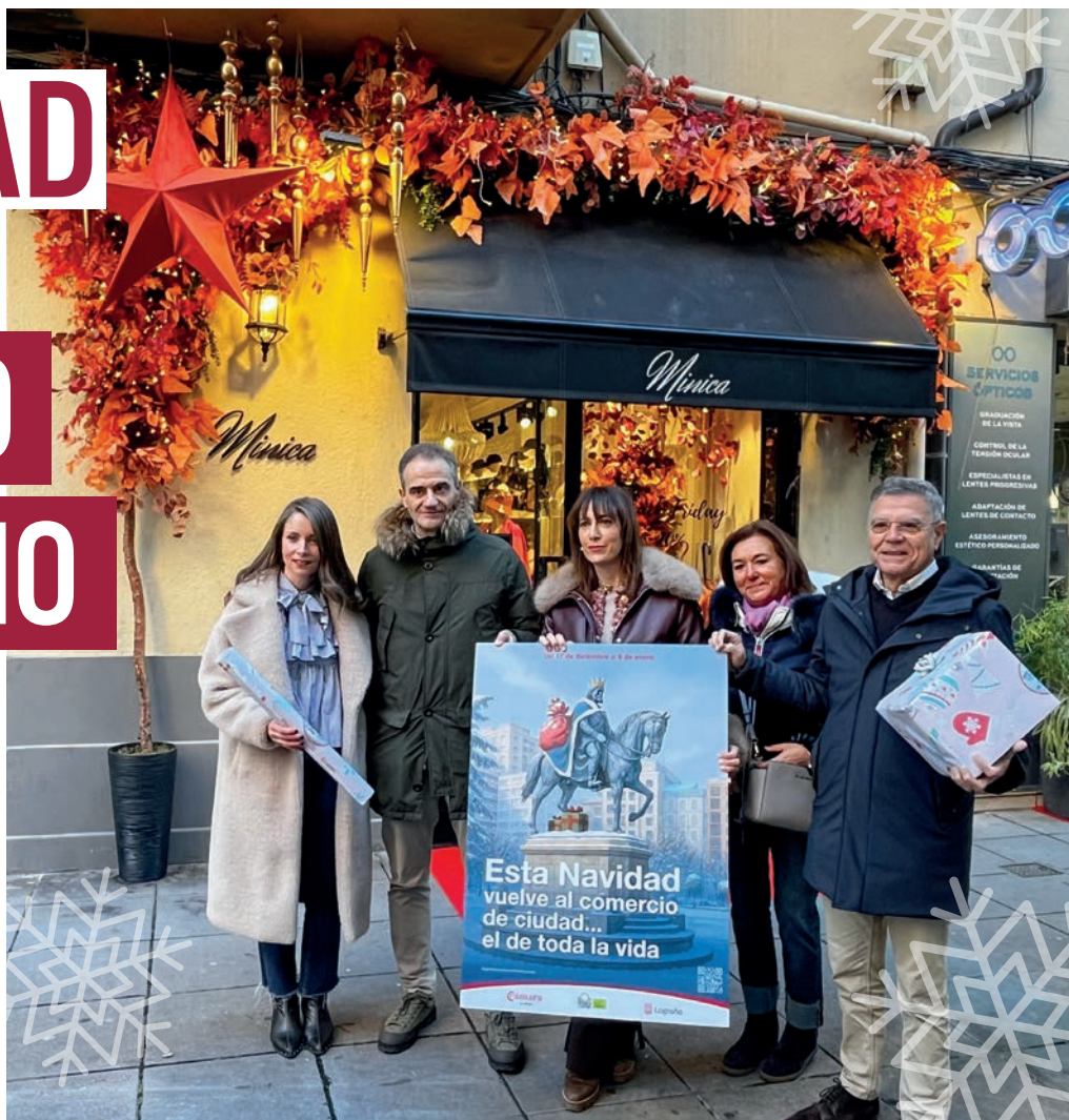
La campaña navideña del comercio local se presentó en la calle Pilar Salarrullana.

Bajo el eslogan 'Esta Navidad, vuelve al comercio de ciudad... el de toda la vida', más de 700 establecimientos de toda la ciudad se han sumado a la campaña de Navidad para dinamizar el comercio local.