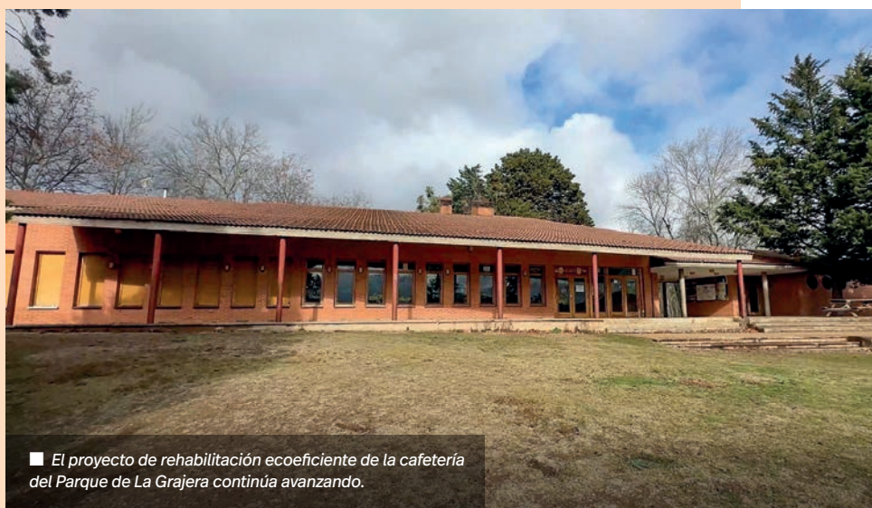
■ El proyecto de rehabilitación ecoeficiente de la cafetería del Parque de La Grajera continúa avanzando.

La Junta de Gobierno Local adjudicó el 3 de diciembre estos trabajos a la empresa Contratación y Ejecución de Obras, S.L. por una cantidad de 503.899,94 euros (IVA incluido).