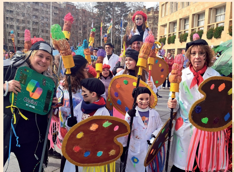
■ A la izquierda, la carroza que ganó y a la derecha personas que salieron en el desfile de Carnaval.